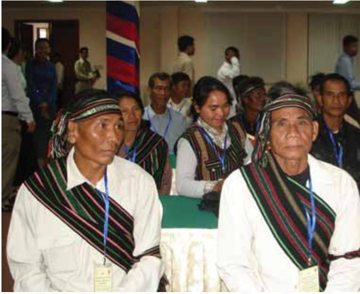
អាជ្ញាធរប្រពៃណីក្នុងក្រុមជនជាតិដើមភាគតិចខេត្តមណ្ឌលគិរី ជួបជាមួយសមាជិកសភា និងពិភាក្សាអំពីការលំបាកនានាដែលពួកគេប្រឈម ក៏ដូចជាអំពីវប្បធម៌ប្រពៃណីប្រពៃណីវប្បធម៌ និងគោលការណ៍ប្រពៃណីផងដែរ (រដ្ឋសភា)