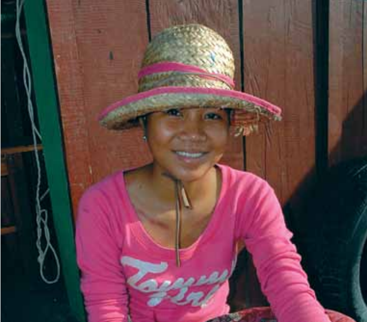
យូអិនឌីកីគាំទ្រកម្ពុជា ក្នុងការស្វែងរកដំណោះស្រាយ ផ្ទាល់ខ្លួន តបនឹងការប្រឈម នៃការអភិវឌ្ឍជាតិ និង ពិភពលោក ។ (យូអិនឌីកី/អ៊ីសាបែល លេសេរ)

នៅក្នុងឆ្នាំ ២០០៩ យូអិនឌីកីនៅកម្ពុជាបានរួមវិភាគទានជាសំខាន់ទៅក្នុងការអភិវឌ្ឍដែលផ្តោតលើជនក្រីក្រ ដោយគាំទ្រដល់អភិបាលកិច្ចតាមបែបប្រជាធិបតេយ្យ ការកាត់បន្ថយភាពក្រីក្រ និងនិរន្តរភាពបរិស្ថាន។ ចំណុចលេចធ្លោនានារួមមាន ការជួយកសាងសម្ព័ន្ធភាពសម្រាប់ឆ្លើយតបនឹងការប្រែប្រួលអាកាសធាតុ ការលើកទឹកចិត្តដល់រដ្ឋាភិបាលឱ្យមានលក្ខណៈឆ្លើយតបតាមវិមជ្ឈការ និងការជម្រុញឱ្យសកម្មភាពរួមប្រទេសជាមួយប្រជាពលរដ្ឋ។ យូអិនឌីកីបានជួយរដ្ឋាភិបាលក្នុងការរួមចំណែករបស់ខ្លួន ក្នុងកិច្ចប្រឹងប្រែងអន្តរជាតិលើការដោះមីន ក្នុងបញ្ហាឱនភាពដី ការគ្រប់គ្រងសារធាតុគីមី សារធាតុបង្ហាញស្រទាប់អូហ្សូន និងក្នុងប្រសិទ្ធភាពជំនួយ។ កិច្ចប្រឹងប្រែងនានាបានផ្តោតលើការអភិវឌ្ឍពាណិជ្ជកម្ម និងការបង្កើតឧស្សាហកម្មនានា និងជម្រុញឱ្យមានជម្រើសជំនួសនៅក្នុងរបរចិញ្ចឹមជីវិត ដែលជួយថែរក្សាជីវៈចម្រុះ និងធនធានធម្មជាតិ។ ការងាររបស់យូអិនឌីកី មានរាប់ចាប់ពីការផ្តល់យោបល់ខាងគោលនយោបាយ រហូតដល់ការបង្កើតសហគមន៍ជួយខ្លួនឯង ដែលអាចឱ្យគ្រួសារនានាដែលម្តាយសំនេររបស់ខ្លួន។