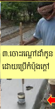
៣.ចោះរណ្តៅដាំកូន ដោយប្រើកំប៉ុងក្តៅ