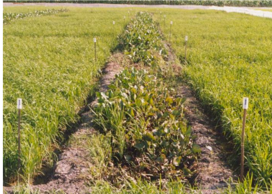
ការវាងចរន្តទឹកហូរ