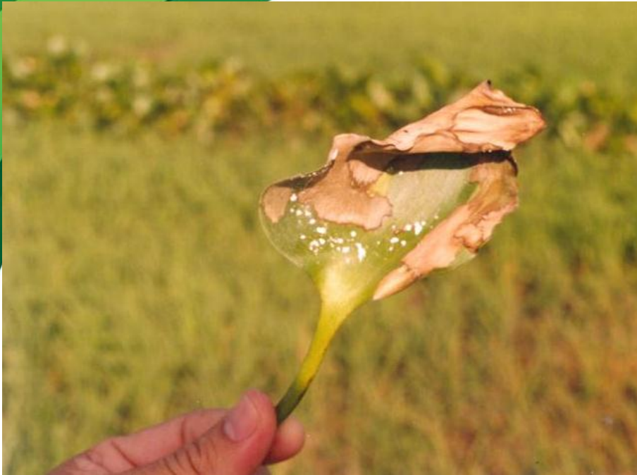
ស្មៅចំលងមេរោគ