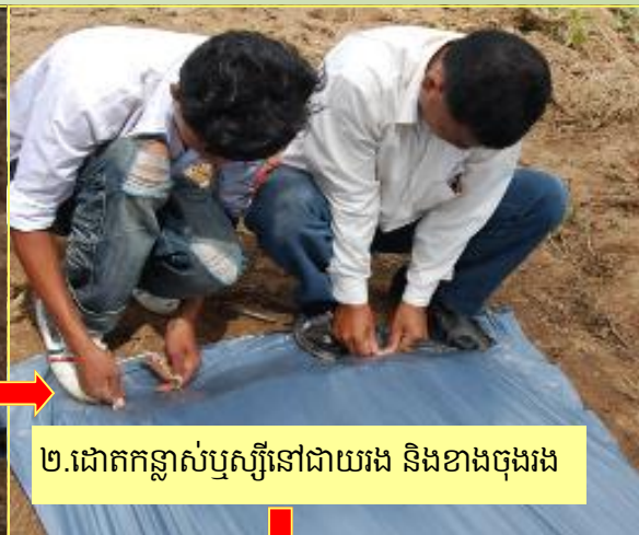
២.ដោតកន្លាស់ឬស្បីនៅជាយរង និងខាងចុងរង