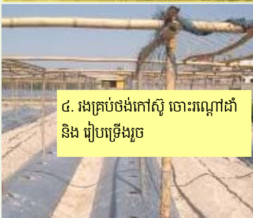
៤. រងគ្រប់ចងកៅស៊ូ ចោះរណ្តៅដាំ និង រៀបទ្រើងរួច