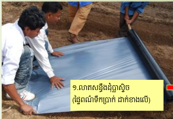
១.លាតសន្ធឹងជុំប្លាស្ទិច (ផ្ទៃពណ៌ទឹកប្រាក់ ដាក់ខាងលើ)